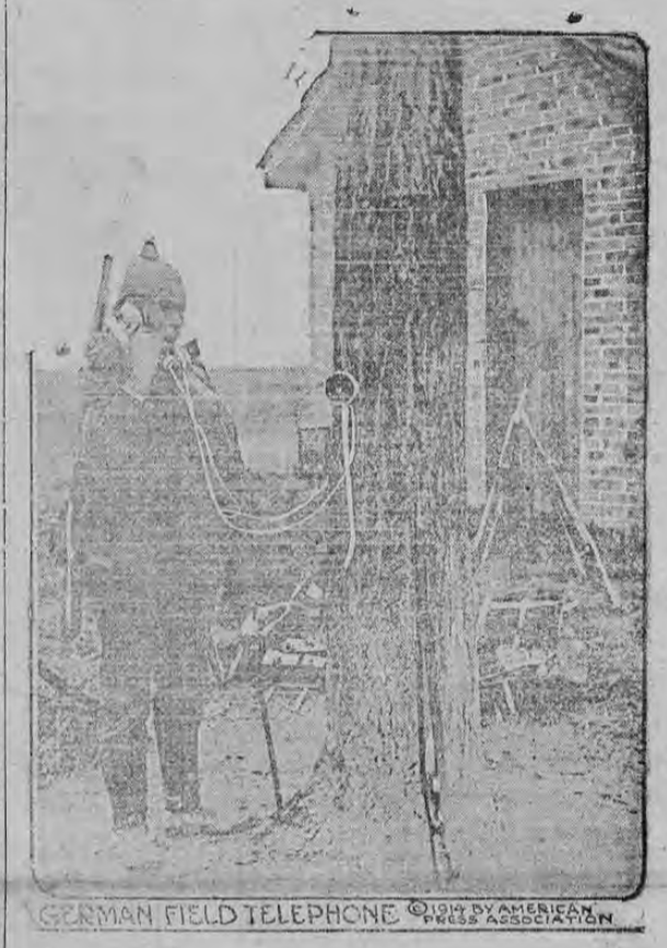
GERMAN FIELD TELEPHONE

Corresponsales que han visitado la línea de fuego, hacen comentarios sobre la supresión de las ordenanzas que para transmitir órdenes, figuraban en anteriores guerras. Teléfonos de campo han suplido a éstos y todas las secciones de un ejército están en comunicación constante por medio de alambres; estos teléfonos pueden ser colocados en cualquier parte.