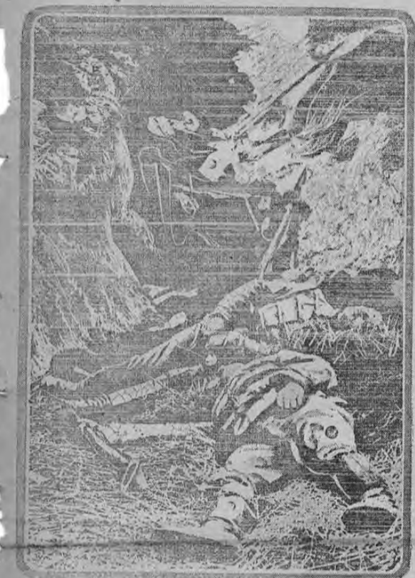
DEAD GERMAN IN TRENCH IN FLANDERS

Este grabado muestra algunos soldados alemanes muertos en una trinchera, en el campo de operaciones de Flandes. La posición fue tomada por los ingleses, después de un formidable asalto. Las trincheras estaban llenas de cadáveres alemanes. Esta fotografía es obra de un corresponsal de guerra, que va con el ejército inglés.