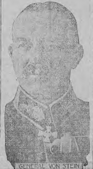
GENERAL VON STEIN

El General von Stein es contraalmirante general del ejército alemán. Sobre sus hombros descansa, desde el principio de la guerra, la enorme tarea de dirigir el departamento de comisariato, teniendo además a su cargo, la provisión de ropa y comestibles fuera de los arreglos sobre transportes.